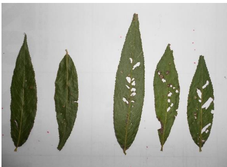
害虫により葉っぱが食われている。樹木には影響無し