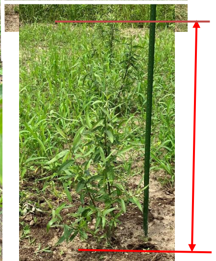
樹高: H=40 cm~58cm