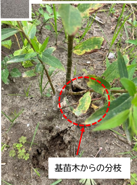
基苗木からの分枝